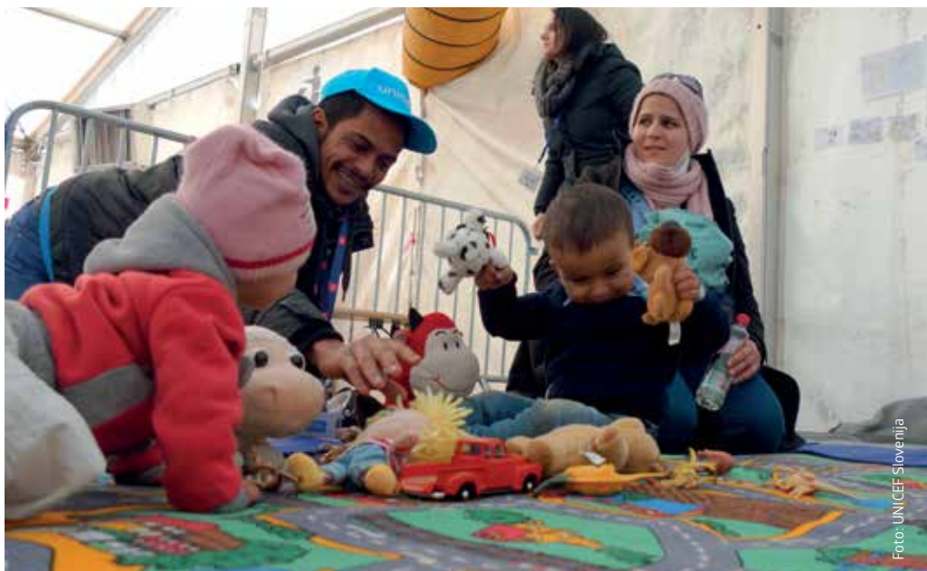
UNICEF-ovo osebje na terenu v Dobovi z igro zabava otroke begunce in migrante, medtem ko ti čakajo, da bodo s svojimi družinami nadaljevali pot.

UNICEF in slovenska partnerska nevladna organizacija Slovenska filantropija se bosta na terenu osredotočila na naslednje ključne ukrepe: